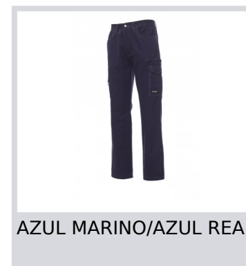
AZUL MARINO/AZUL REAL