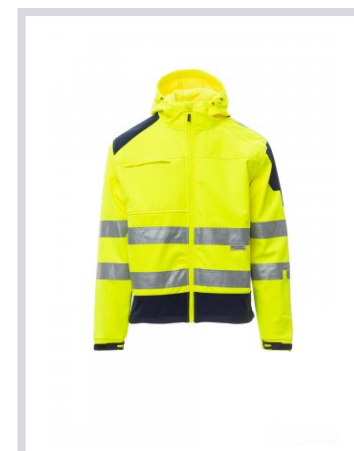
AMARILLO FLUORES CENTE/AZUL MARINO