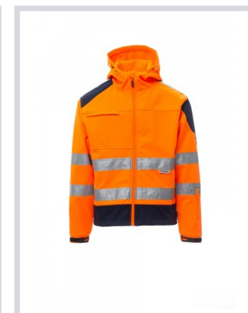
NARANJA FLUORESC ENTE/AZUL MARINO